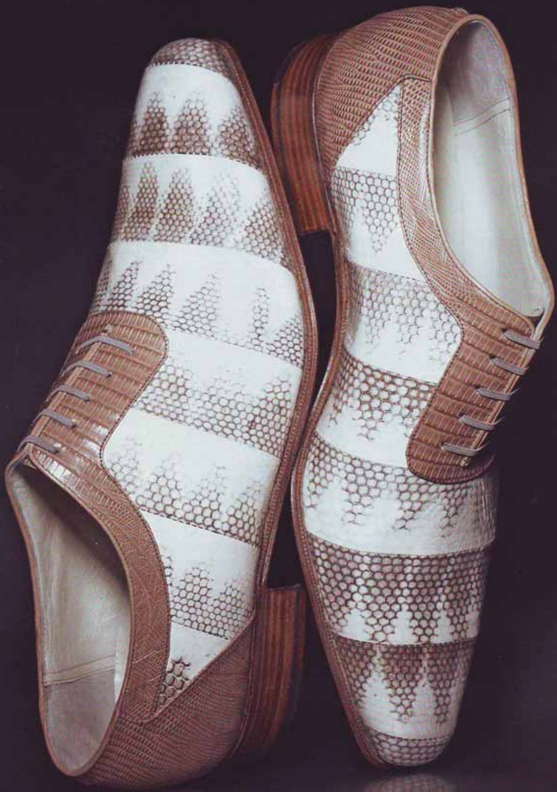
Туфли из кожи змеи и ящерицы, Artioi. Бутик Artioi, Крокус Сити Молл, 1-й эт., +7 495 727 1970